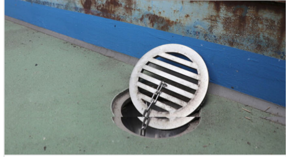
橋梁用 ステンレス排水装置

・発注者/自治体：中部地方整備局 岐阜国道事務所 ・排水装置納入日：2023.04 ・撮影日：2024.07 [...]