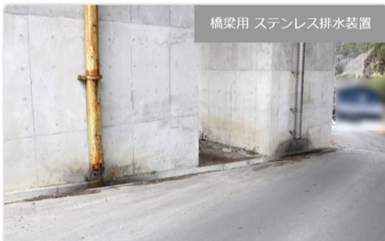
橋梁用 ステンレス排水装置

・発注者/自治体：中部地方整備局 飯田国道事務所 ・排水装置納入日：2019.12 ・撮影日：2024.01 [...]