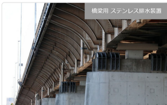
橋梁用 ステンレス排水装置