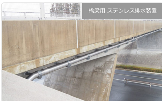
橋梁用 ステンレス排水装置

・発注者/自治体：中部地方整備局 飯田国道事務所 ・排水装置納入日：2013.02 ・撮影日：2021.03 [...]