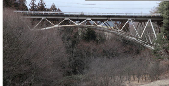
橋梁用 ステンレス排水装置

・発注者/自治体：中部地方整備局 飯田国道事務所 ・排水装置納入日：2009 ・撮影日：2024.01 高気密 [...]