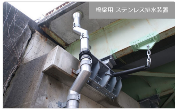
橋梁用 ステンレス排水装置

・発注者/自治体：中部地方整備局 飯田国道事務所 ・排水装置納入日：2012.11 ・撮影日：2022.03 [...]