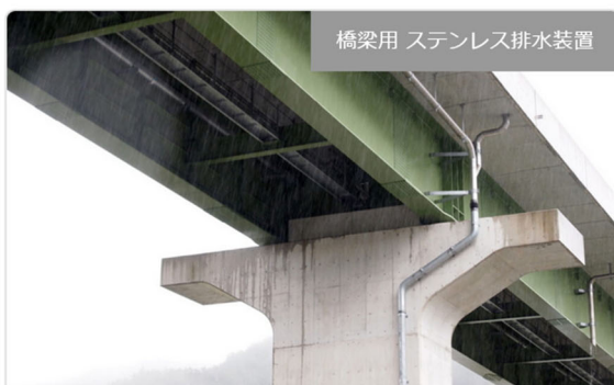
橋梁用 ステンレス排水装置

・発注者/自治体：中部地方整備局 高山国道事務所 ・排水装置納入日：2011.10 ・撮影日：2014.10 […]