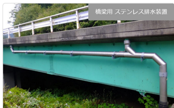
橋梁用 ステンレス排水装置

・発注者/自治体：中部地方整備局 飯田国道事務所 ・排水装置納入日：2014.05 ・撮影日：2014.05 [...]