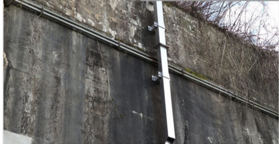
橋梁用 ステンレス排水装置

・発注者/自治体：中部地方整備局 北勢国道事務所 ・排水装置納入日：2022.03 ・撮影日：2023.03 [...]