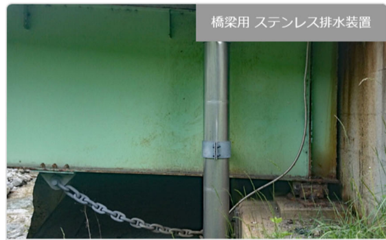
橋梁用 ステンレス排水装置

・発注者/自治体：中部地方整備局 飯田国道事務所 ・排水装置納入日：2016.11 ・撮影日：2022.03 [...]