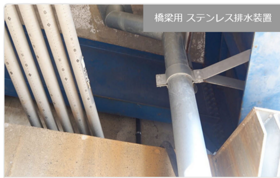
橋梁用 ステンレス排水装置

・発注者/自治体：中部地方整備局 多治見砂防国道事務所 ・排水装置納入日：2015.06 ・撮影日：2019. [...]