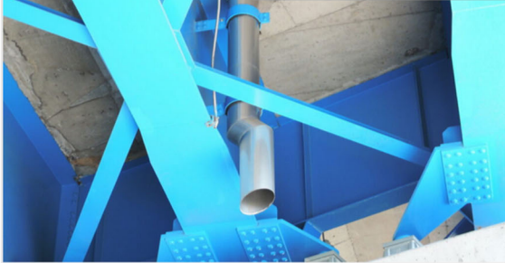
橋梁用 ステンレス排水装置

・発注者/自治体：中部地方整備局 名古屋国道事務所 ・排水装置納入日：2013.05 ・撮影日：2014.04 [...]