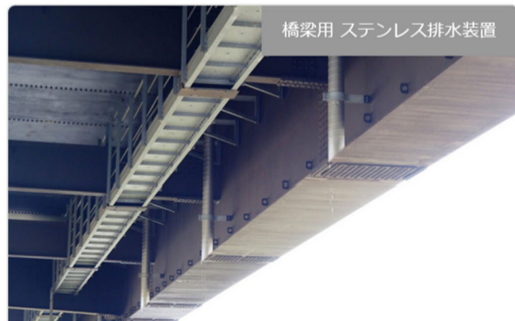
橋梁用 ステンレス排水装置

・発注者/自治体：中部地方整備局 三重河川国道事務所 ・排水装置納入日：2001.09- ・撮影日：2021. [...]