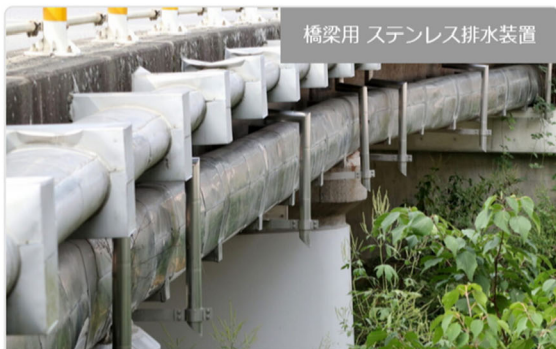
橋梁用 ステンレス排水装置

・発注者/自治体：中部地方整備局 飯田国道事務所 ・排水装置納入日：2022.03 ・撮影日：2023.12 [...]