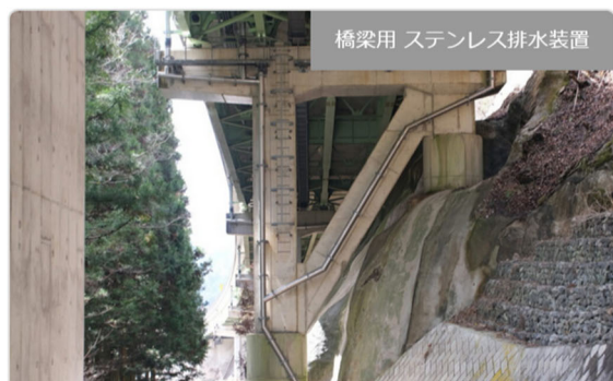
橋梁用 ステンレス排水装置

・発注者/自治体：中部地方整備局 飯田国道事務所 ・排水装置納入日：2019.10 ・撮影日：2022.03 [...]