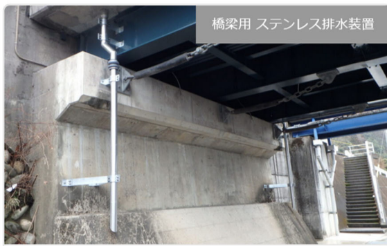
橋梁用 ステンレス排水装置