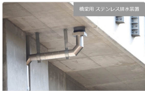
橋梁用 ステンレス排水装置

・発注者/自治体：中部地方整備局 紀勢国道事務所 ・排水装置納入日：2012.10 ・撮影日：2017.03 [...]