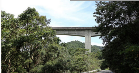
橋梁用 ステンレス排水装置

・発注者/自治体：中部地方整備局 紀勢国道事務所 ・排水装置納入日：2012.02 ・撮影日：2023.08 [...]