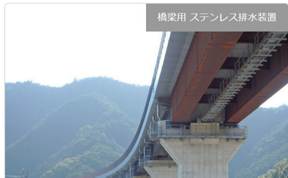
橋梁用 ステンレス排水装置

・発注者/自治体：中部地方整備局 紀勢国道事務所 ・排水装置納入日：2013.06 ・撮影日：2017.03 [...]