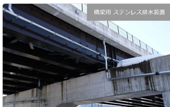
橋梁用 ステンレス排水装置

・発注者/自治体：中部地方整備局 高山国道事務所 ・排水装置納入日：2013.03 ・撮影日：2015.06 [...]